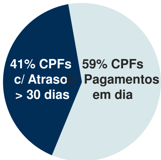
CPFs - Contratos Finalizados